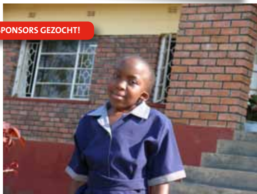
Masvingo dovenschool, Zimbabwe